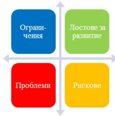
Фиг. 1. SWOT анализ на регионалната система