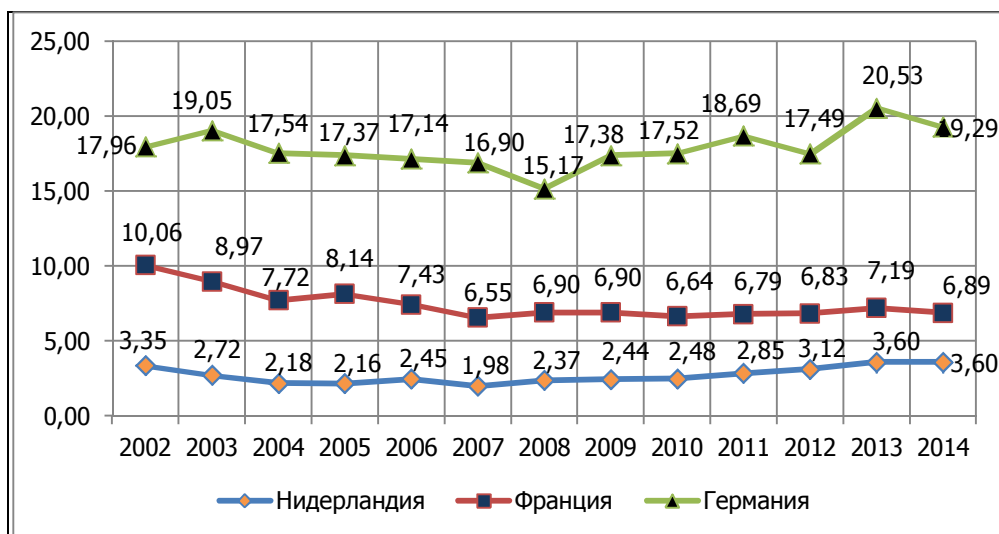
Фигура 3. Дял на Германия, Франция и Нидерландия в българския износ към ЕС за периода 2002-2014 г., в проценти

Източник: Собствени изчисления на база на данни от НСИ (2016, януари 29). Статистически данни. Взето на 29.01.2016 г. от http://www.nsi.bg/bg/