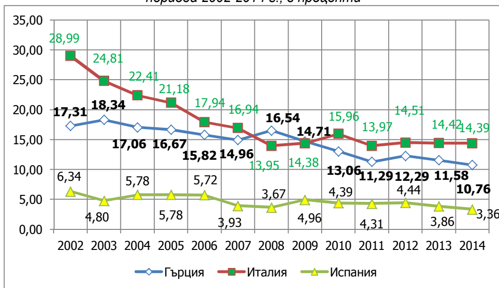
Фигура 4. Дял на Италия, Гърция и Испания в българския износ към ЕС за периода 2002-2014 г., в проценти

Източник: Собствени изчисления на база на данни от НСИ (2016, януари 29). Статистически данни. Взето на 29.01.2016 г. от http://www.nsi.bg/bg/