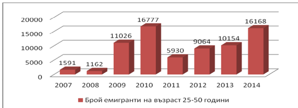
Фигура 1. Български емигранти на възраст 25 – 50 години за периода 2007 – 2014 г.

По данни на Националният статистически институт най-много са емигрирали от България лица на възраст между 25 и 50 години. Представа за емигрантите обхващащи тази възрастова група ни дават данните от Фигура 1.