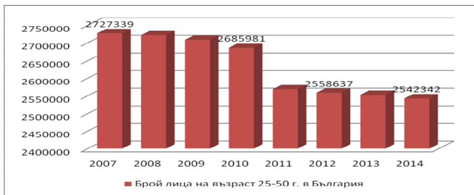
Фигура 2. Население в България – общ брой лица на възраст 25 – 50 години за периода 2007 – 2014 г.

Представа за лицата живеещи в България на възраст 25-50 г. ни дава Фигура 2.