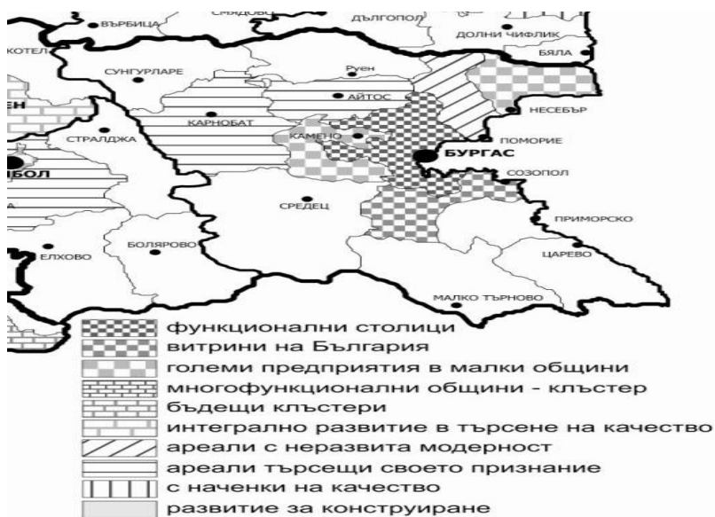
Фигура 4. Локални модели на регионално развитие

БУРГАС е от ПЪРВИ ТИП – ГРАДСКИ ПОЛЮСИ и от вид „Мулти-специализирани полюси”, функционални столици (Шишманова, М. 2011).