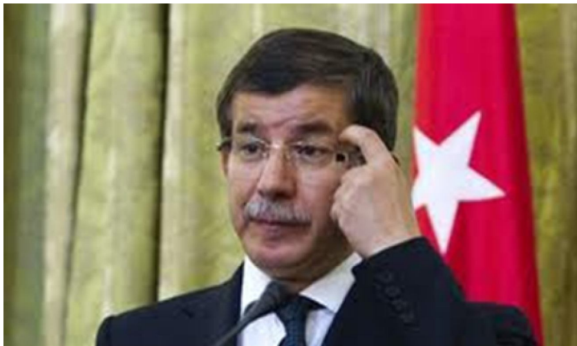
Фиг.5. Архитект на геополитическата концепция на „неоосманизма“ е турският външен министър Ахмет Давутоглу.

Редица заявления на Ахмет Давутоглу дават добра представа за Концептуалната същност на „неоосманизма“: