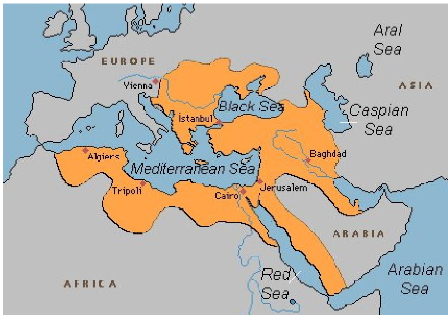
Фиг.1. Карта на Османската империя

Целите на дадения доклад е да се направи преглед на този феномен, да се синтезират определени реалистични оценки и изводи, както и да се очертаят възможни перспективи и предизвикателства. Тези цели се постигат чрез следните задачи, структурирани в няколко раздела, а именно: