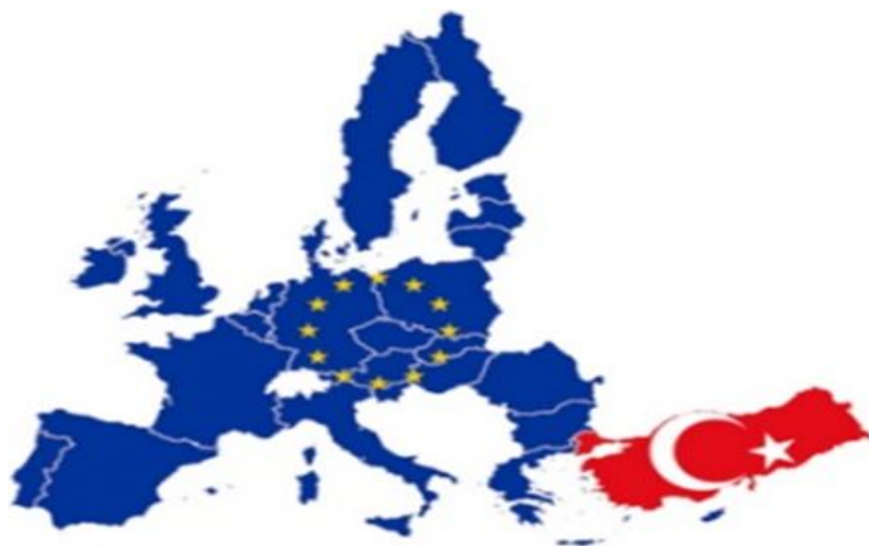
Фиг.4. Турция и ЕС(Европейския съюз)