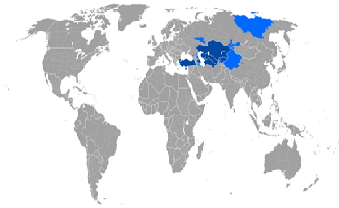
Фиг.3. Карта на разпространението на тюркските народи в глобален план