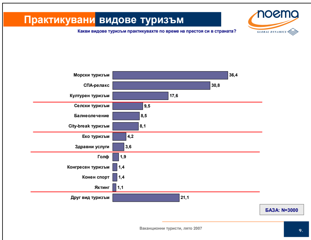
Фиг.№ 1. Ваканционни туристи в България за лято 2007 (данни от проучване на фирма „Ноема“ за ДАТ, слайд №9)

Рехабилитаторите се обучават в медицинските колежи. Дано реформата не засегне това засега добро обучение, макар и осигуряващо недостатъчен брой кадри. Говори се, че някои от колежаите били на доизживяване. В годините на промяна станахме свидетели, че не винаги желанието да правим реформи е добре подплатено с възможностите да ги извършим. Крайно време е да се разбере, че върху стабилните стари основи е редно и е по-лесно да се надгражда, а не непрекъснато да се разрушава.